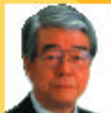
矢田立郎氏 神戸市長