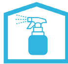
消毒用アルコールの設置 室内の除菌を徹底